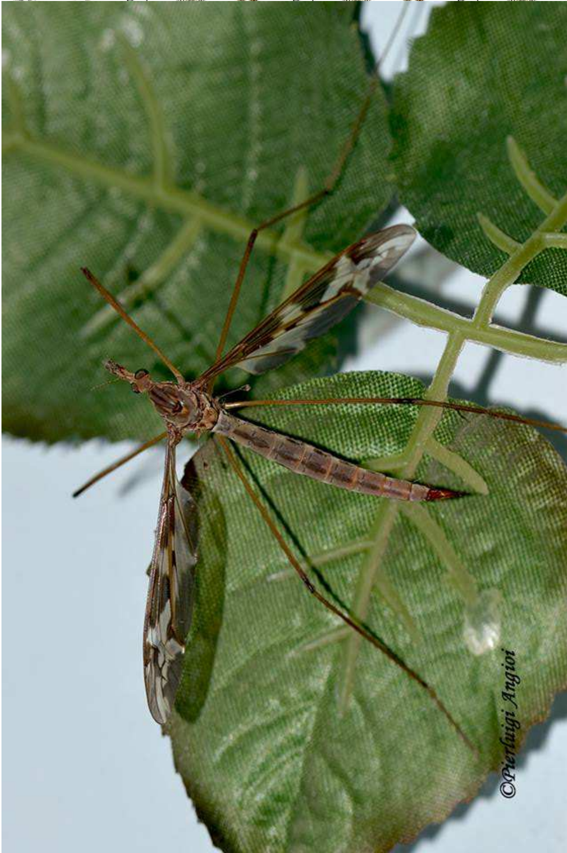
Tipula maxima Poda, 1761 (female) - Tipulidae