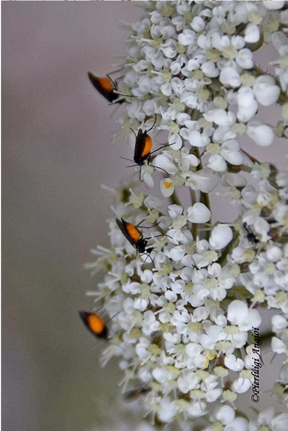
Sciara sp - Sciaridae